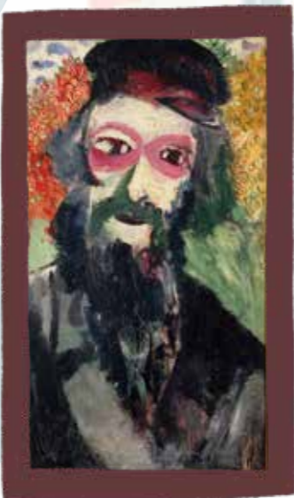
Marc Chagall, The Father, 1911 © Philippe Miguet - Centre Pompidou, MNAM-CCI / Dist. RMN-GP © ADAGP, Paris, 2019

السريالية هي شكل من أشكال الفن يستكشف الأحلام وعوالم الخيال. يظهر الناس والأشياء في الفن السريالي بألوان غير معتادة، حتى أنهم أحيانًا يطفون أو يرقصون.