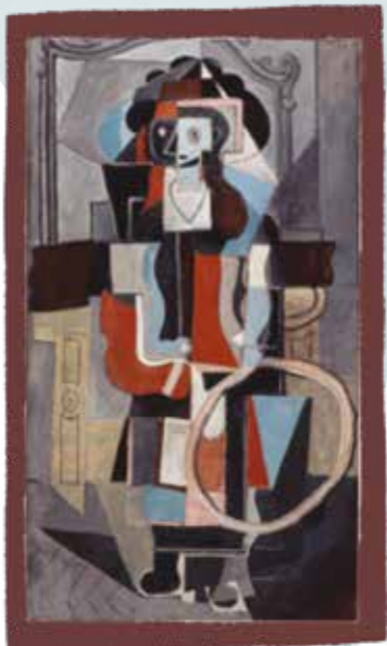
Pablo Picasso, Young girl with a hoop, 1919

أنت هنا! أنا بابلو بيكاسو. لظالما أردت أن أرسم بشكل مختلف، لذا فقد علمت نفسي أن أرسم باستخدام خيالي، كأني طفل. تبدو لوحاتي غالبًا كما لو أنها قد فُككت إلى أشكال هندسية صغيرة.