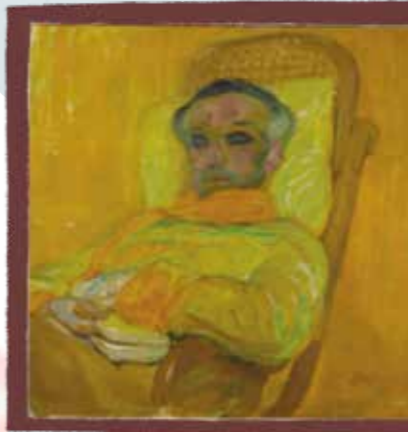
Frantisek Kupka, The Yellow Scale, 1907 (C) Centre Pompidou, MNAM-CCI, Dist. RMN-Grand Palais / Jean-Claude Planchet (C) ADAGP, Paris, 2019

مرحبًا! اسمي فرانتيشيك كويكا. أنا أشتهر باستخدام الألوان للتعبير عن انفعالاتي بدلًا من إظهار الأشخاص والأشياء كما هم في الواقع. أليس ذلك غريبًا وممتعًا؟